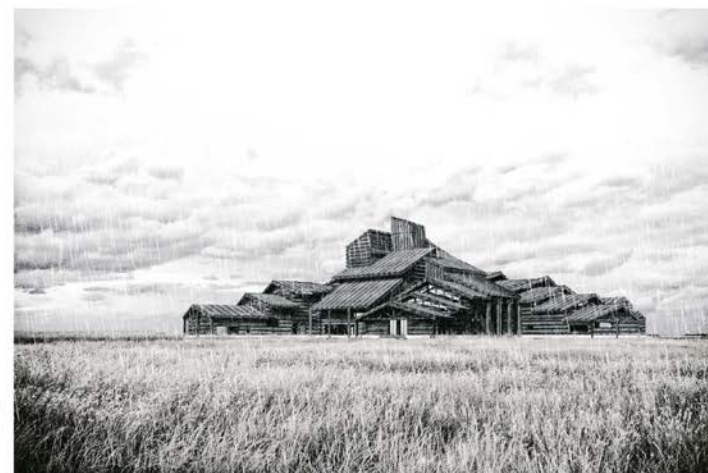
Предложение культурно-образовательного центра с театром в городе Торжок

Целью этого проекта – создать ансамбль, который станет культурно-туристическим центром Торжка и сможет привлечь жителей крупных городов к возрождению провинции.